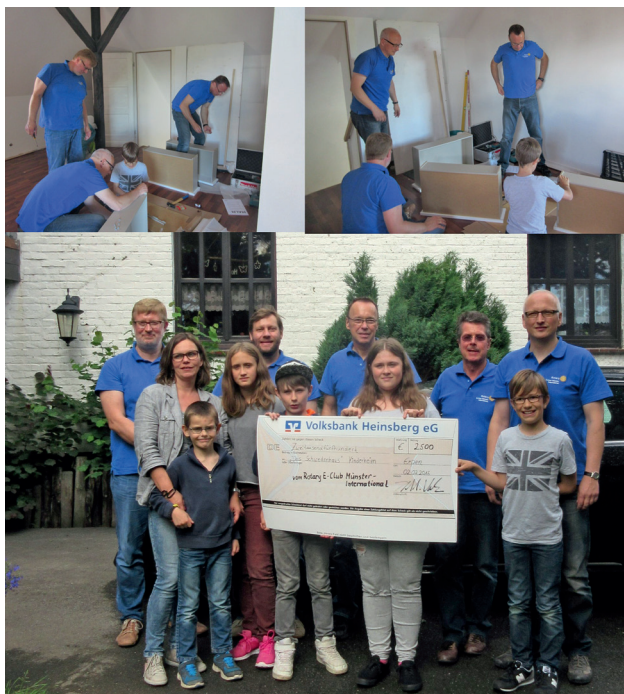
Die fünf Freunde des E-Clubs haben fünf neue junge Freunde gefunden

gab. Die Rekordaufbauzeit von lediglich fünf Stunden war dann keine Frage mehr. Nach getaner Arbeit stand noch eine Stärkung vom Grill bei einem gemeinsamen Essen mit den Kindern und Mitarbeitern der Einrichtung an. Insgesamt war es eine gelungene Aktion mit viel Spaß, aber auch nachdenklichen Momenten. Der REC wünscht den neuen Bewohnern viel Freude in ihren Zimmern und hofft, dass sie sich wohlfühlen werden: ganz nach dem Motto der Einrichtung „Lass dich nicht unterkriegen, sei frech und wild und wunderbar.“ (Astrid Lindgren). ♦ kjh.das-schwedenhaus.de